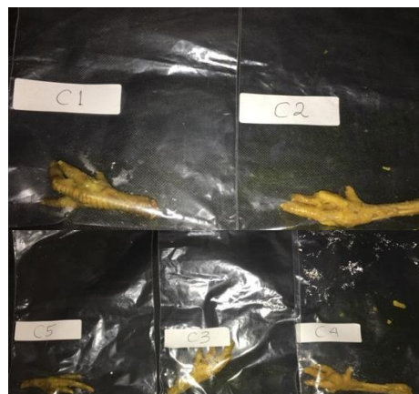
Gambar 1. Sampel Ceker Ayam

Penelitian deskriptif kualitatif yang digunakan berguna untuk menggambarkan bagaimana tingkatan pencemaran mikroorganisme Salmonella sp. pada ceker ayam dalam makanan soto ayam yang dijual oleh pedagang kaki lima di Kota Denpasar. Penelitian dimulai dengan pengambilan sampel dengan prosedur aseptik dan diberikan label C1-C12, kemudian dilakukan prosedur tahap-tahap uji keberadaan mulai dari penanaman sampel ceker pada media SSA lalu diinkubasi pada suhu 37°C untuk nantinya dilakukan pengamatan. Adapun hasil observasi tersebut yaitu disajikan pada tabel 2.