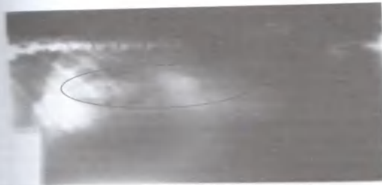
Gambar 1. Gambaran radiografi daerah abdomen yang menunjukkan masa padat (lingkaran).

Prosedur bedah enterotomi yang dilakukan pada kasus konstipasi kronis yang diderita pasien berlangsung lancar dan sukses hingga masa padat yang berupa feces berhasil dikeluarkan. Pada gambaran Radiografi terlihat masa padat pada daerah abdomen (Gambar 1). Prosedur bedah enterotomi dapat dilihat pada Gambar 2). Pasca operasi, pasien diberikan antibiotik Cefotaxime TM ( Cefotaxm sodium 1g/ secara IV ) setiap 12 jam, dan antiradang ibuprofene (SC) selama 3 hari. Selain itu, untuk mengurangi gerakan peristaltik usus menggunakan atropin, pasien dipuasakan selama 24 jam.