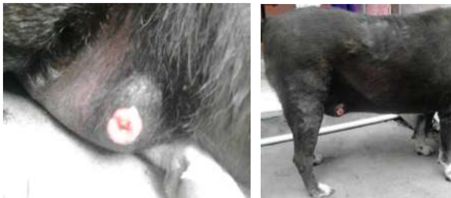
Gambar 1. Tumor pada Anjing Kasus

Hasil pemeriksaan fisik menunjukkan frekuensi napas 20 x/menit, pulsus 69 x/menit, suhu tubuh 39,6°C, CRT normal (<2 detik) dan denyut jantung 65 x/menit. Anjing dipuasakan makan selama 12 jam sebelum operasi. Adapun tujuannya adalah untuk mengosongkan isi lambung sehingga pada saat operasi dapat mencegah terjadinya muntah.