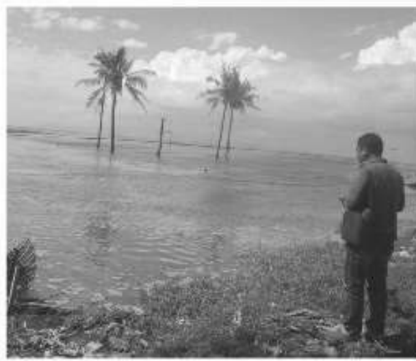
Gambar 3: Permukaan air laut naik dipantai Lembang, Kecamatan Banjarangkan, Kabupaten Klungkung, Bali menggenangi sawah petani sebagai fenomena pemanasan global /perubahan iklim.