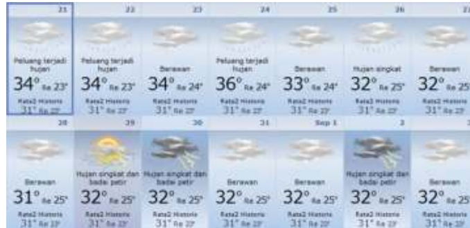
Gambar 2: Kondisi cuaca Bali akhir Agustus sampai permulaan September 2016 yang masih diwarnai oleh keadaan berawan dan hujan. (Sumber: BMKG Bali 10 Agustus 2016).