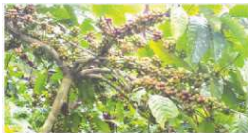
Gambar 1: Buah kopi jenis robusta perkebunan petani didesa Sepang, Kecamatan Busungbiu, Kabupaten Buleleng, Bali. Buah mengalami kerontokan akibat curah hujan berlebihan (phenomena La-Nina ). (Sumber: Bali Post 18 Juli 2016).

Kepiting bakau ( Scylla Serrata ). Sebagai rangkaian naiknya permukaan air laut dipantai Lembang, kabupaten Klungkung, ada lagi peristiwa lain. Dipulau Nusa Penida yang masih wilayah kabupaten sama, terlihat sejumlah kepiting bakau ( Scylla Serrata ) hijrah kesebuah gua kuno tidak jauh dari pantai dengan kumpulan hutan bakau. Kasus perpindahan satwa ini kemungkinan disebabkan oleh habitat kepiting tersebut mengalami gangguan (penebangan bakau oleh penduduk, kematian yang disebabkan oleh beberapa faktor dll) sehingga tidak nyaman dan pindah kehabitat yang lebih cocok yaitu Gua Giri Putri. Kemungkinan lain terjadi alih fungsi lahan hutan bakau menjadi areal tambak atau peruntukan lain seperti perumahan, hotel, jalan dan infrastruktur yang lain. Hasil pengamatan alih fungsi lahan juga terdapat di beberapa tempat di Bali, misalnya kota Denpasar (Gambar 5). Dengan kata lain terjadinya kemajuan dibidang sosioekonomi masyarakat ( escalating human socioeconomic activities ) selama dua ratus tahun terakhir merupakan salah satu penyebab alih fungsi, sesuai dengan pendapat Brinson and Malvarez (2002).