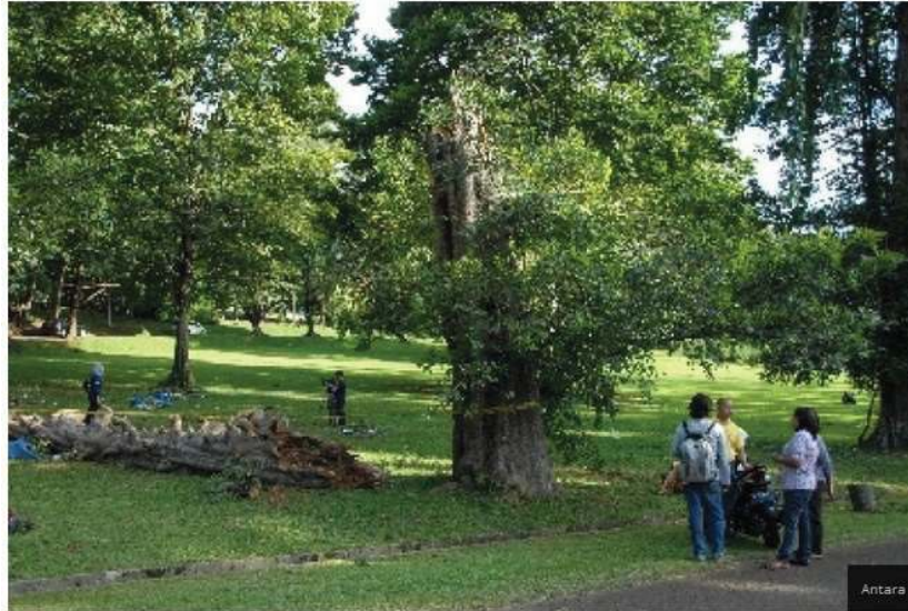
Gambar 7: Kebun Raya Pilan Gianyar, Bali

Usaha adaptasi dan mitigasi kerusakan lingkungan. Data mengenai usaha pemerintah bersama rakyat dalam rangka adaptasi dan mitigasi kerusakan lingkungan disajikan pada Tabel 1, Gambar 6 dan Gambar 7. Kebun Raya Bedugul memiliki areal taman dan hutan lindung dengan luas sekitar 157,5 hektar dengan koleksi tanaman yang mencapai kira-kira 16.000 tanaman yang terdiri dari 1.500 jenis, 320 marga, dan 155 suku tumbuhan. Dapat dibagi menjadi beberapa kelompok baik itu tanaman untuk dilindungi maupun tanaman liar yang merupakan tanaman hias, tanaman buah, tanaman obat, tanaman untuk bahan-bahan upacara, dsb. Terdapat juga taman anggrek / orchid park dengan berbagai koleksinya (Gambar 6). Selain itu Pemerintah Kabupaten Gianyar, Bali berencana membangun kebun raya tematik di Kawasan Hutan Adat Pilan, Desa Kerta, Payangan. Ini akan menjadi kebun raya ke-30 di Indonesia (Gambar 7) dengan luas 10 ha. Ditambah lagi usaha pemerintah bersama rakyat mempertahankan luasan hutan rakyat yang kini mencapai 24.549 ha