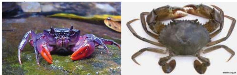
Gambar 4:(kiri): Kepiting biru ( Callinectes sapidus ) yang muncul akibat pengaruh pemanasan global dan (kanan) kepiting bakau ( Scylla Serrata )