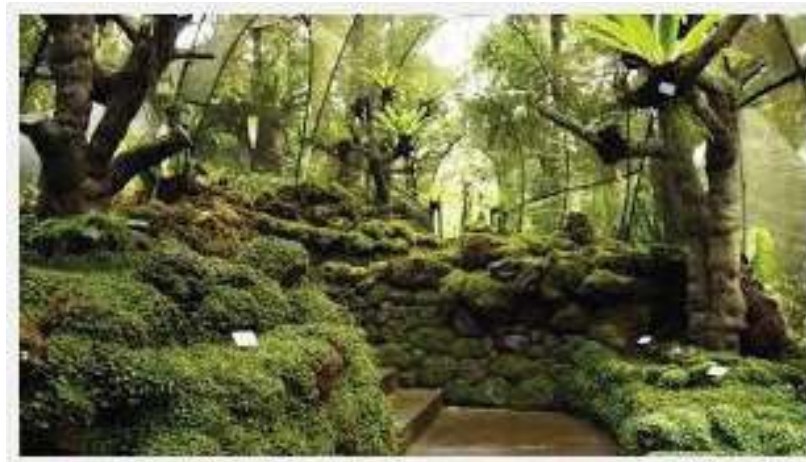
Gambar 6: Kebun Raya Eka Karya Bedugul, Bali