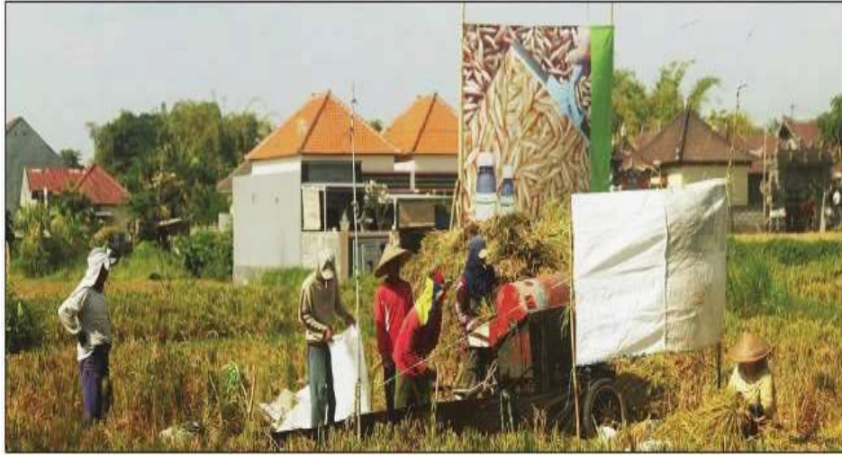
Gambar 5: Alih fungsi lahan pertanian menjadi pemukiman penduduk akibat pesatnya pertumbuhan penduduk sekitar kota Denpasar, Bali. (Sumber: Bali Post 8 Agustus 2016).