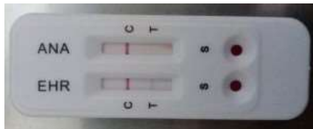
Gambar 3. Hasil Test kit Positif Ehrlichiosis