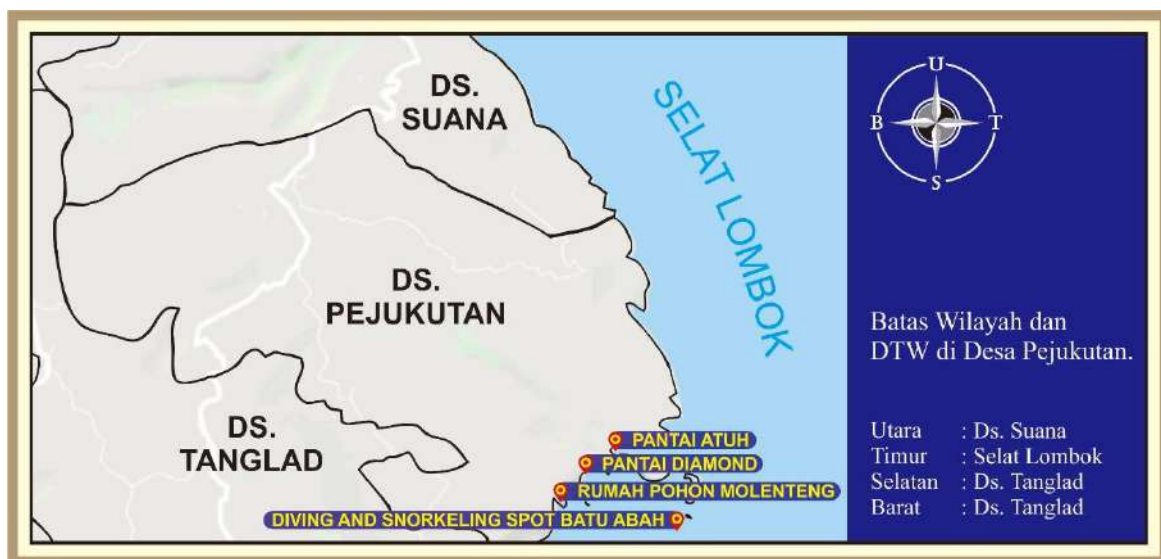
Gambar 1. Batas Wilayah dan DTW di Desa Pejукutan

Penelitian ini menggunakan pendekatan penelitian kualitatif. Penelitian ini dilakukan di DTW Pantai Diamond, Dusun Pelilit, Desa Pejукutan, Kecamatan Nusa Penida, yang dimulai pada bulan April hingga Juli 2019. Jenis data yang digunakan adalah kualitatif dan kuantitatif, sumber data berasal dari data primer dan sekunder yang dikumpulkan dengan metode triangulasi, yaitu observasi, wawancara, survey, dan studi dokumen. Instrumen yang digunakan adalah check list , daftar pertanyaan, angket, kamera, dan recorder . Hasil analisis data disajikan secara deskriptif interpretatif.