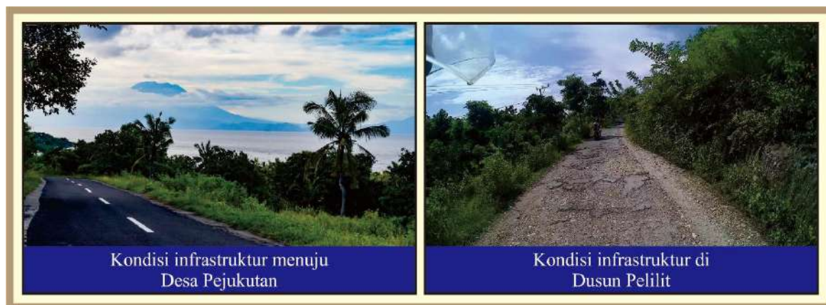
Gambar 3. Kondisi Infrastruktur Menuju Desa Pejukutan dan di Dusun Pelilit