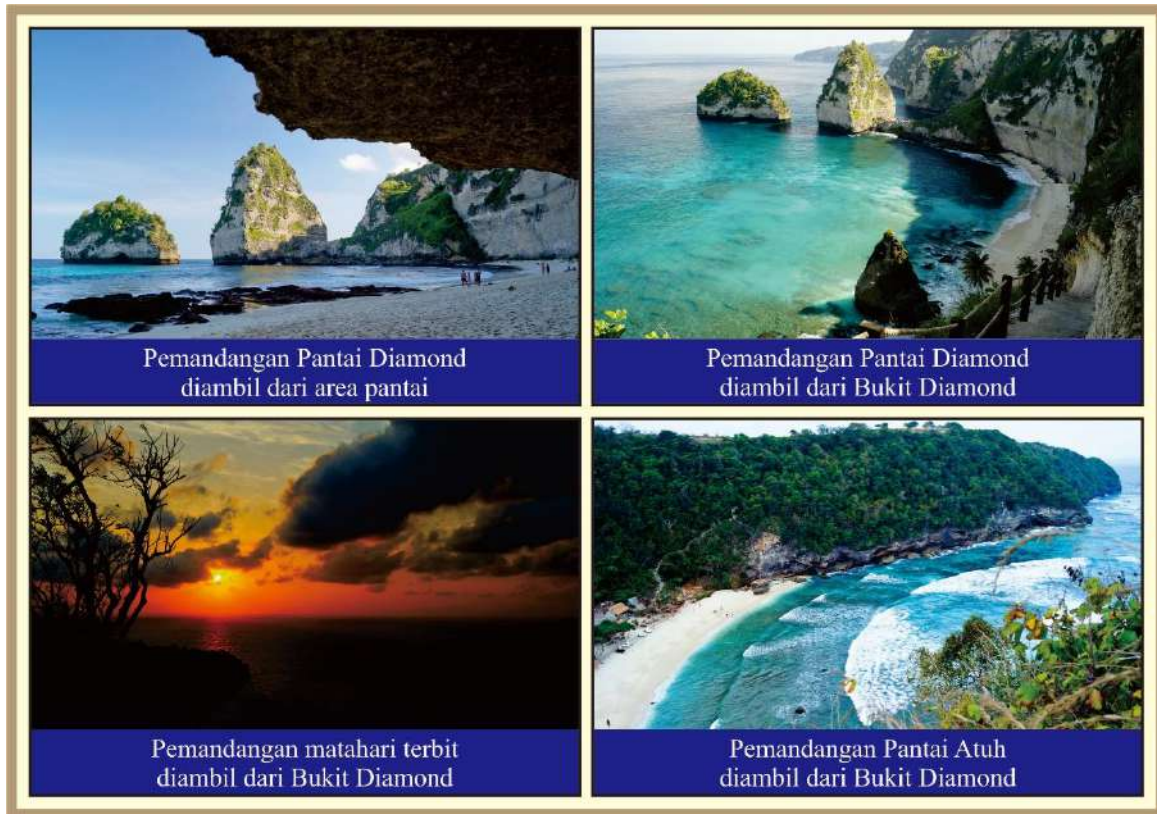
Gambar 2. Kualitas Pemandangan Alam DTW Pantai Diamond