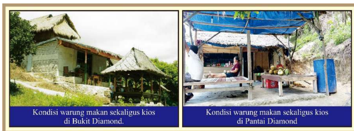
Gambar 4. Fasilitas Warung Makan dan Kios di DTW Pantai Diamond

Masyarakat sebagai responden penelitian didominasi oleh masyarakat yang berasal dari Desa Pejukutan dan bekerja sebagai SDM Pariwisata di Dusun Pelilit, berjenis kelamin pria dengan rentang usia antara 35 – 49 tahun.