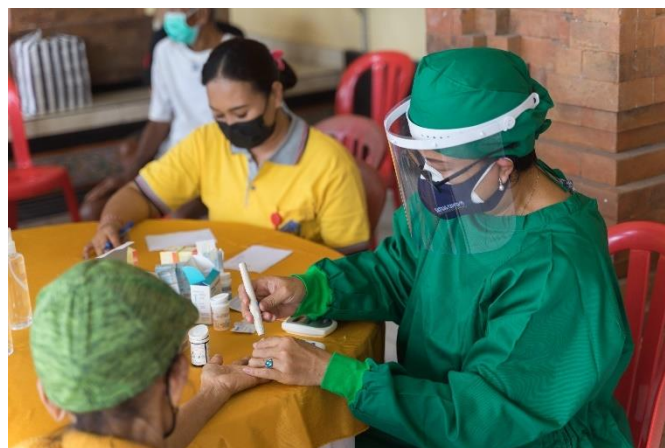
Gambar 3.3 Dokter Memeriksa Kadar Asam Urat dan Kolesterol