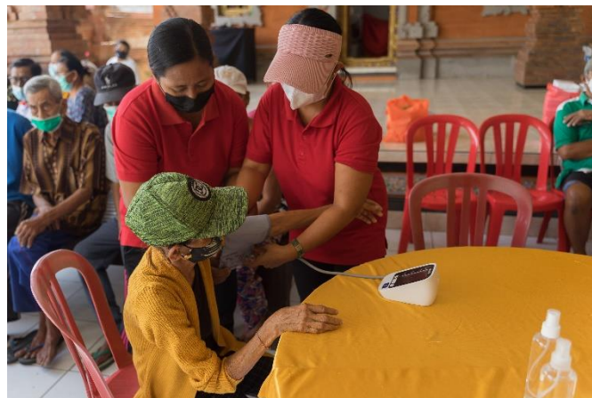
Gambar 3.2 Para Kader Posyandu Lansia yang Sudah Terlatih Memeriksa Tekanan Darah