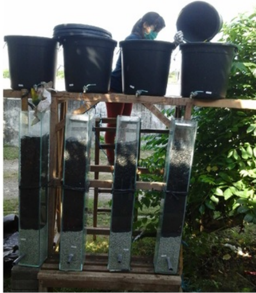
Gambar 1. Desain Sistem Biofilter

Ni) yang terdapat dalam air limbah (Shofianty, 1999 dalam Sihombing, 2007). Setelah melewati bak biofilter air limbah ditampung pada bak penampungan akhir, dan selanjutnya dianalisis di laboratorium.