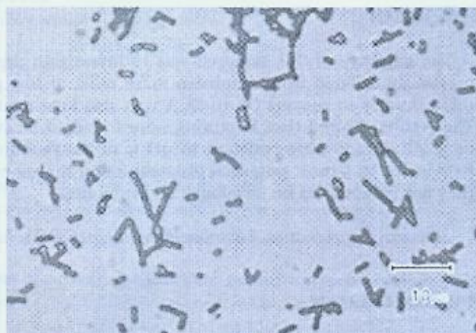
Gambar 1. Lactobacillus sp. setelah dilakukan pewarnaan gram. Warna ungu menunjukkan bahwa bakteri ini termasuk bakteri Gram positif.

Berdasarkan pewarnaan gram, bakteri Lactobacillus yang diamati berwarna ungu seperti yang terlihat pada Gambar 1.