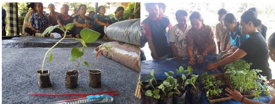
Gambar 4. Hasil grafting tanaman tomat diperkenalkan pada acara pelatihan budidaya hortikultura dan grafting (kiri) dan Anggota MKRPL Desa Getasan sedang berlatih teknik grafting (Kanan)

Potensi desa Getasan dengan 665 KK dengan komoditi utama petani adalah padi sedangkan untuk hortikultura masih minim. Sehingga melihat potensi tersebut maka melalui program penyuluhan dan pelatihan grafting serta budidaya tanaman hortikultura seperti sayur-mayur diharapkan mata pencaharian lebih beragam. Selain itu masyarakat desa Getasan dapat mulai memanfaatkan lahan pekarangan yang kosong kurang produktif menjadi lebih berguna dan produktif sebagai lahan untuk ditanami tanaman hortikultura kebutuhan sehari-hari keluarga seperti cabai, tomat, terong, dll. Jadi, melalui program kegiatan peningkatan produksi pertanian ini diharapkan masyarakat desa Getasan mampu memaksimalkan lahan pekarangannya menjadi lebih produktif dengan ditanami tanaman keluarga sehingga kebutuhan akan bahan pangan atau makanan sehari-hari lebih terpenuhi dan secara tidak langsung makanan yang diolah dari tanaman pekarangan lebih sehat daripada membeli di pasar karena ditanam dan dirawat sendiri.