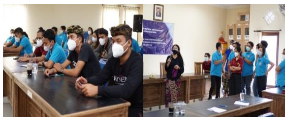
Gambar 2.2. Kegiatan Pemberian Materi dan Praktek Role Play

Pelaksanaan kegiatan dimulai dengan pemberian kuesioner pre test untuk mengetahui tingkat pengetahuan dan sikap kader remaja STT, dilanjutkan dengan sesi ceramah yaitu pemaparan materi mengenai kesehatan reproduksi, kemudian diskusi tanya jawab untuk menjawab segala permasalahan atau kendala yang masih dirasakan oleh para peserta. Dalam sesi role play , dibentuk dua kelompok dan masing-masing kelompok melakukan role play dalam pemberian edukasi atau promosi kesehatan reproduksi yang telah disusun sebelumnya dalam diskusi kelompok. Pada sesi akhir dilakukan pemberian kuesioner post test untuk mengetahui peningkatan pemahaman, pengetahuan, dan sikap kader remaja terkait materi yang telah diberikan selama kegiatan pendampingan.