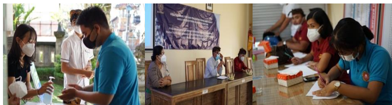
Gambar 2.1. Kegiatan Persiapan dan Pre Test