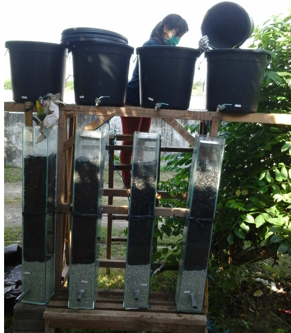
Gambar 1. Desain Sistem Biofilter

Ni) yang terdapat dalam air limbah (Shofianty, 1999 dalam Sihombing, 2007). Setelah melewati bak biofilter air limbah ditampung pada bak penampung akhir, dan selanjutnya dianalisis di laboratorium.