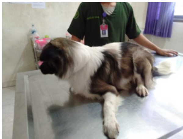
Gambar 1. Dokumentasi pribadi anjing kasus

Anjing ras kintamani berjenis kelamin jantan dengan umur satu tahun memiliki bobot badan 9,2 kg. Anjing memiliki rambut berwarna hitam putih, berpostur tubuh tegap, behavior dan habitous pendiam.