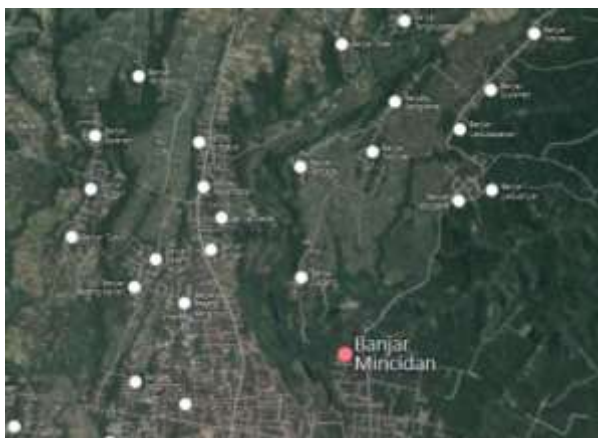
Gambar 1. Peta lokasi Banjar Mincidan ( https://tripcarta.com/26513184 )

Bali sudah lama menjadi daerah tujuan wisatawan domestik maupun manca negara. Sumber daya hayati, keindahan alam dan seni budaya dapat menjadi atraksi bagi pengunjung. Saat ini, wisatawan cenderung memilih wisata alam, terutama bagi pengunjung yang gemar mendaki, 'trekking', 'jogging', 'cycling', 'diving', dll. Pemanfaatan sumber daya alam terutama daerah yang memiliki topografi perbukitan atau keberadaan sumber air dari sungai dan mata air dapat menarik pengunjung.